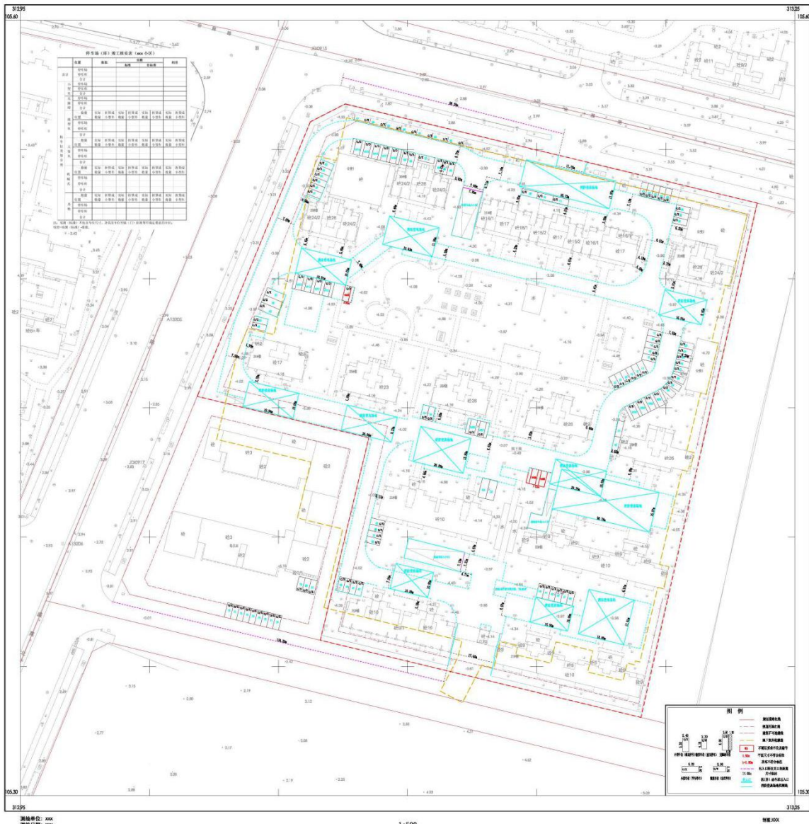
基地总平面布置核实测量平面图样图